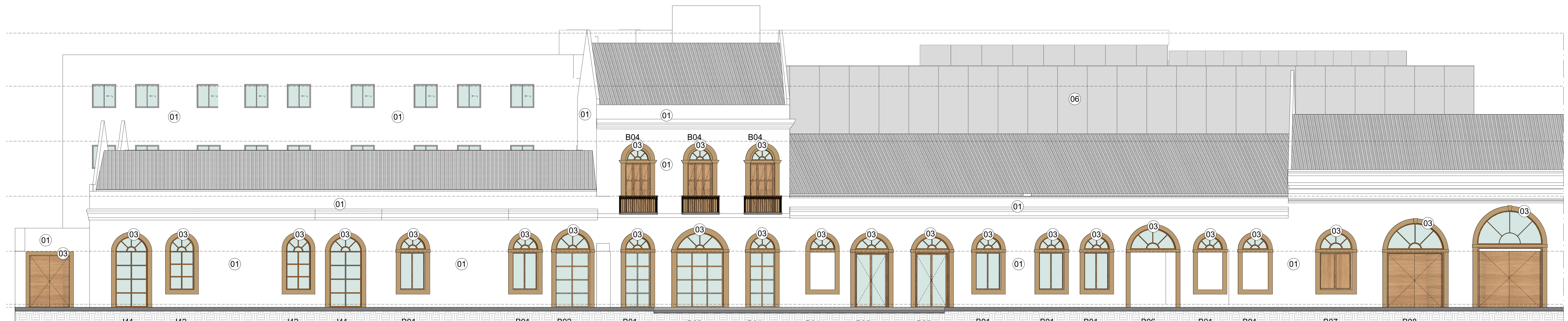
FACHADA NORTE - PARTE 01 ESCALA: 1:75