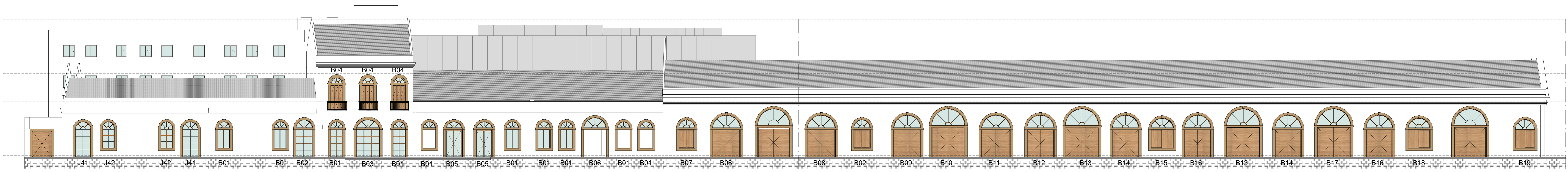
FACHADA NORTE - GERAL ESCALA: 1:125